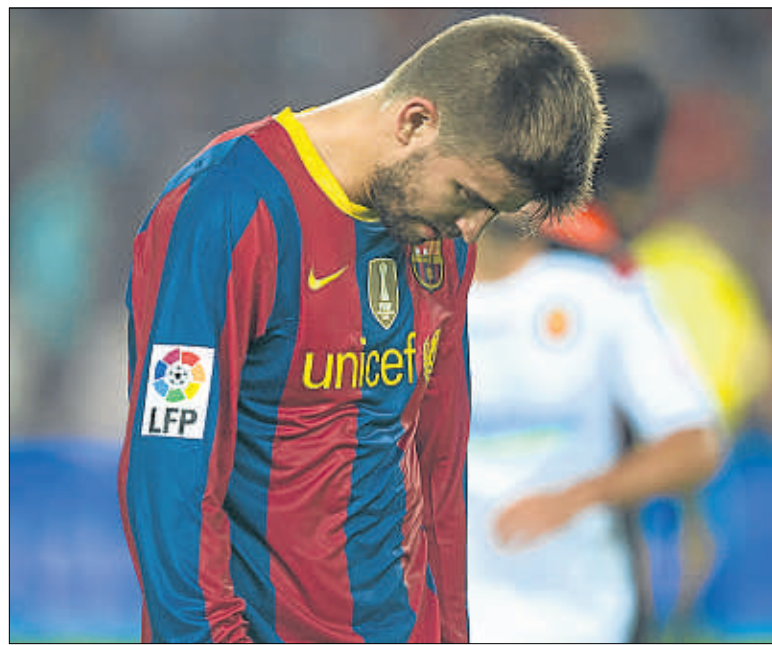
Piqué, decepcionado Los jugadores no disimularon su gran disgusto

fue una pequeña obra de arte, pero no la única del primer tiempo. Poco antes, Leo, abarcando con libertad una gran franja de campo, había habilitado a Abidal (¡qué exhibición de fuerza y clase del francés!), a cuyo pase no llegó Bojan. Ya con el 1-0, un Pedro excelente dio otro pase vertical que dejó solo a Messi ante Aouate, pero el argentino quiso driblar al meta y perdió la verticalidad de la portería.